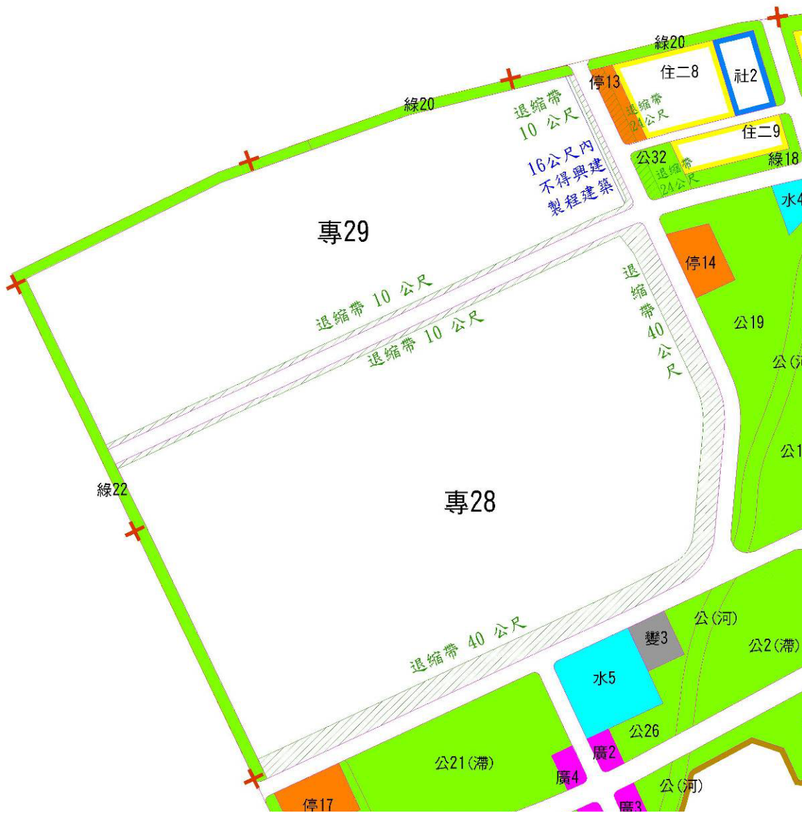
圖 4 變更後退縮帶劃設位置及寬度示意圖